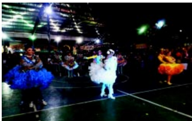
A quadrilha Coração Sertanejo abrilhantou a festa com uma apresentação moderna e original.