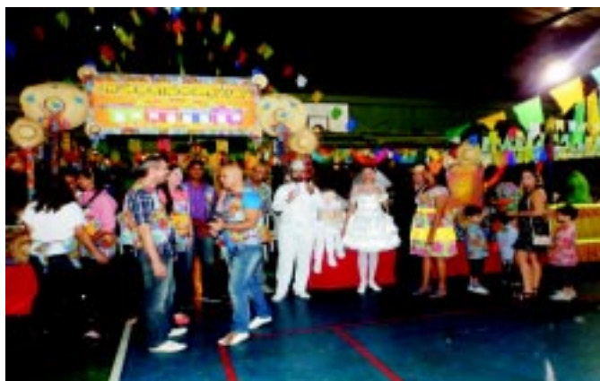
O HGeF venceu o concurso de melhor barraca, nos quesitos animação, decoração e originalidade.