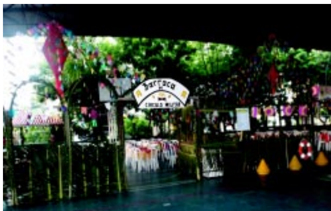
Barraca do Círculo Militar