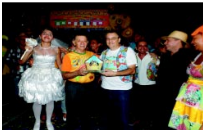
O Gen Souza fez a entrega do troféu de melhor barraca ao Diretor do Hospital Militar.