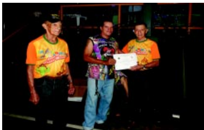
O presidente do CMF fez a entrega de um diploma de participação ao representante do Coração Sertanejo.